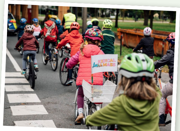
Kidical Mass September 2022