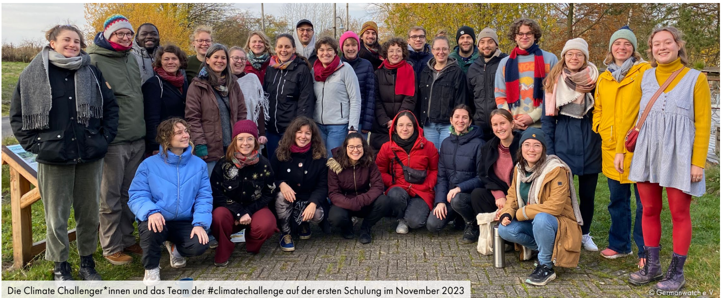
Die Climate Challenger*innen und das Team der #climatechallenge auf der ersten Schulung im November 2023