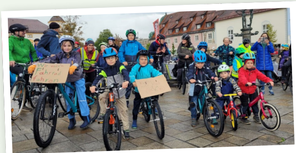
Kidical Mass September 2022 / Foto: Lukas Klose

Kinder, die von klein auf aktiv mit dem Fahrrad und zu Fuß unterwegs sind, bleiben es auch als Erwachsene. Mit den Aktionen – v.a. Kidical Mass Fahrrademos, Schulstraße und Fahrradbus (Bicibús) – wird ein positives Zukunftsbild gezeichnet und Veränderungen werden erlebbar. Parents for Future Deutschland sind seit 2023 Teil des Kidical Mass Aktionsbündnisses.